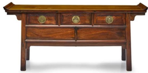
图5 明晚期 花梨联三式 户橱