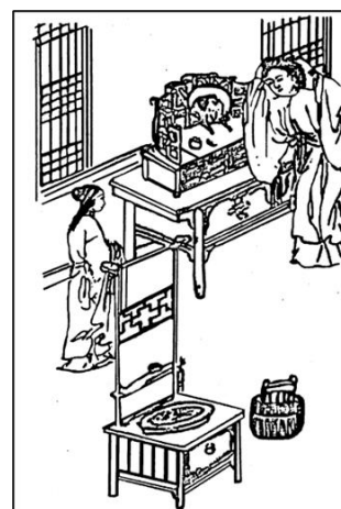
图 3 班经匠家