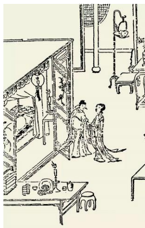
图 2 聚 堂刻本

虽然闷户橱的闷仓结构在使用上有些繁琐,但其较好的私密性极其适合用作收纳女子出嫁时携带的首饰等贵重物件,闷仓结构不仅扩充了储物空间,也对增强闷户橱整体结构的强度起到了一定作用。闷户橱不论抽屉多少,又叫‘嫁底’。因为过去嫁女总要陪嫁一两件闷户橱。橱上或放箱只,或放掸瓶、时钟、帽筒、镜台之类,用红头绳绊扎。故‘嫁底’是由于它作为嫁妆之底而得名 [7] 。闷户橱下方可堆放书册或是不常用的日常杂物,实用性极高。明崇祯聚锦堂刻本《西湖二集》的版画中(图 2)体现出闷户橱在当时的使用功能类似于如今的梳妆台,与卧室中的其他用具构成了系统的睡眠空间,明万历刊本《鲁班经匠家镜》插图版画中(图 3)的闷户橱与镜台、洗脸架构成卧室空间的一角,同时也说明闷户橱是明清时期普遍的卧室用具。