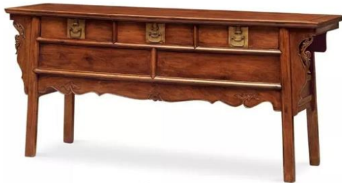
图6 明晚期 花梨素联三式 户橱