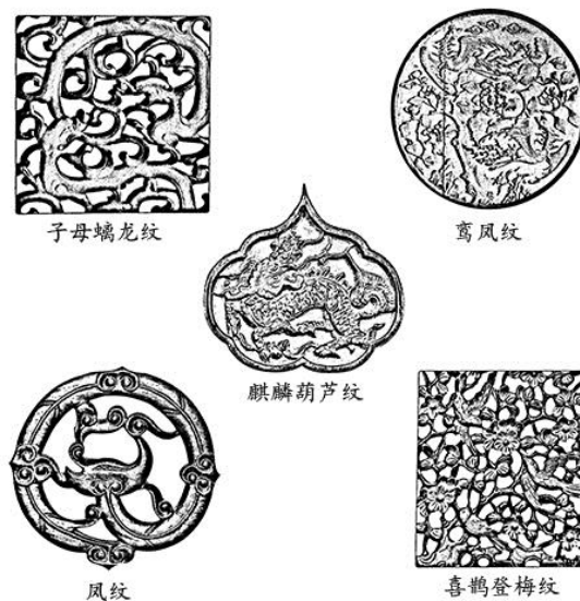
图 8 明式家具纹 图案五大类

梅兰竹菊四君子、莲花、和合二仙、鹤、蝙蝠、双鱼、睢鸠等图案，具有祝福长寿、夫妻和睦、福满天地、百年好合的含义，表现了人们对新婚夫妻婚姻生活的美好祝福，这些祝福和祈求是婚嫁用具的专用语言。闷户橱的装饰艺术体现了传统艺术对新的家庭生活的期盼理念，从闷户橱可延展到嫁妆的精神文化，其本质都是对婚礼活动美满举行的期望和对夫妻婚姻生活的殷切祝福，也是古今中外流传至今人们对婚姻的祝愿，是全人类对美好生活的本能追求，同时，对婚姻活动中奢华的婚嫁器物的追求也符合人类合理的精神欲望。