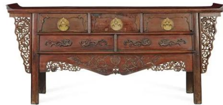
图7 明晚期 花梨带翘头 螭 联三 户橱

中国各代各个时期的家具装饰形态都各有千秋,以闷户橱产生的朝代为例,明式家具的装饰图案简练大方,懂得取舍,取精华去糟粕,这一时期生产出的家具被称为中国家具艺术的巅峰,是家具装饰艺术的鼎盛时期。明式家具在造型、装饰、功能等方面散发出东方哲学的文化内涵,承载了博大精深的中国传统文化 [8] 。明式闷户橱在装饰手法上主要以雕刻为主,配合木纹和附属五金构件来体现,具有天然而不尚装饰、精湛而不落工巧的造物特点,符合中国传统的美学规律,具有典型的明代风格。装饰题材内容丰富,主要有云纹、灵芝、龙纹、螭纹、花鸟、走兽、山水、人物、凤纹、宗教图案等 [9] 。早在远古时期的图腾性符号、神话传说的形象纹饰一直流传到明清时期,因此,在明式家具中,纹饰图案的象征意义与其装饰意义相比更为重要,婚庆主题的纹样图案也在明代走向多元化。《诗经》是中国第一部诗歌总集,诗歌在抒情时离不开比喻,从而需要具体物象作为比喻的本体,意象是诗歌的灵魂,动物意象是其中重要的一部分,是传播诗歌意境的载体,是先民思想观念的体现和精神情感的寄托,也凭借自身美好的形象而一直受到人们的追捧,许多中国传统家具设计装饰图案都来源于《诗经》中对动物意象的歌颂。人类与动物在很多方面都有相似之处,情感、作息、生活习惯等,所以动物常被人们用来比喻和谐美好的爱情。《诗经·关雎》写到:“关关雎鸠,在河之洲。”雎鸟相向合鸣,互相依恋,激发了君子对淑女的爱慕之情。《诗经·鸳鸯》吟:“鸳鸯于飞,毕之罗之。”鸳鸯雌雄相守,偶居不离,借鸳鸯来比喻美好的配偶,表达夫妻之间的相互厮守之情。因此,鸳鸯被人们视作男女感情浓厚的意象,成为男女之间白头偕老,百年好合的美好象征,体现了古人对恩爱婚姻和美好生活的向往,而鸳鸯的纹样图案也成为了婚嫁家具中不可或缺的装饰。古人们在婚嫁用具上雕刻美好寓意图案,传递对婚姻的美好祝愿。麒麟纹是明式家具装饰图案五大类之一,晋·王嘉《拾遗记》里记载道:“夫子(孔子)未生时,伤感网名,有麟吐玉书于阙里人家。”麟吐玉书,是指孔子未降生时吉祥的征兆,后来麒麟被人们看作圣贤和杰出人士的代表,“麒麟儿”和“麒麟送子”的说法也在民间逐渐传播开来,麒麟纹饰渐渐成为象征子孙昌盛、多子多福的一种符号,揭示了古代婚姻中人们浓厚的祈子求嗣的社会心理。闷户橱的闷仓面板处多刻有子母螭龙纹、鲤鱼跳龙门纹、禄星纹、石榴纹、一品仙鹤纹、一路连科纹,都表达了古人们对未来后代子孙读书入仕、金榜题名、光耀门庭的期盼。